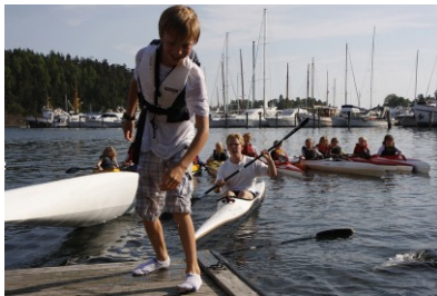
Kajakkskole ved brygga

BKVe mener at dette arealet bør brukes til andre formål, og at det finnes flere alternativer for lagring av båter som ikke beslaglegger et så viktig landområde. Vi ønsker en forlengelse av Ro- og padlebanen, som ligger inne i den godkjente reguleringsplanen, samt annen sportsrelatert bruk og rekreasjon med naturlig tilknytning til sjøen.”