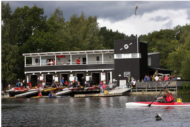
Oslo Kajakklubb sett fra vannet

Oslo Kajakklubb (OKK) viser til utkast til Kommuneplan for Oslo som er lagt ut til offentlig ettersyn med høringsfrist 30. mai 2014. Dette er vår høringsuttalelse til planen. Hovedkommentarene våre er innrammet.