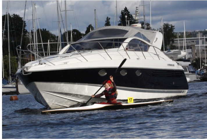
Det må etableres en plan for trygg padling i Oslofjorden

Kommuneplanens uforholdsmessige fokusering på økt tilrettelegging for fritidsbåter er etter vår vurdering ikke smart bruk av begrenset areal, det gir ikke en trygg utvikling for fjordens myke brukere, og det er ikke grønt da fritidsbåter forurenses vann 1 og luft.