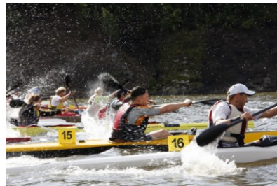
Kajakkrace i Bestumkilen