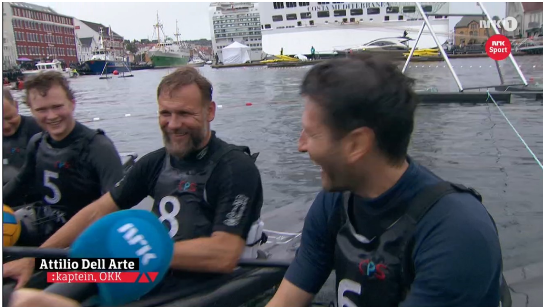
NM-Finalen gikk i beste sendetid på NRK . Gull til OKK!