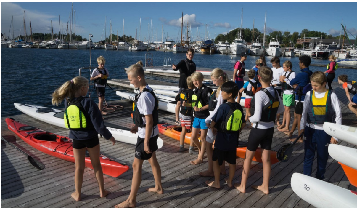
Herlig med stor bryggeplass!