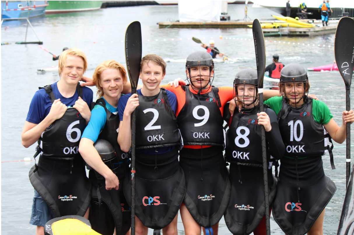
OKKs juniorlag fikk 5. plass i NM – kun i konkurranse med seniorlag

Den største satsingen for pologruppen er å øke deltakelse av unge og løfte juniorlag til et internasjonalt nivå, samt fortsette med et sterkt seniorlag og et åpent tilbud om sommeren.