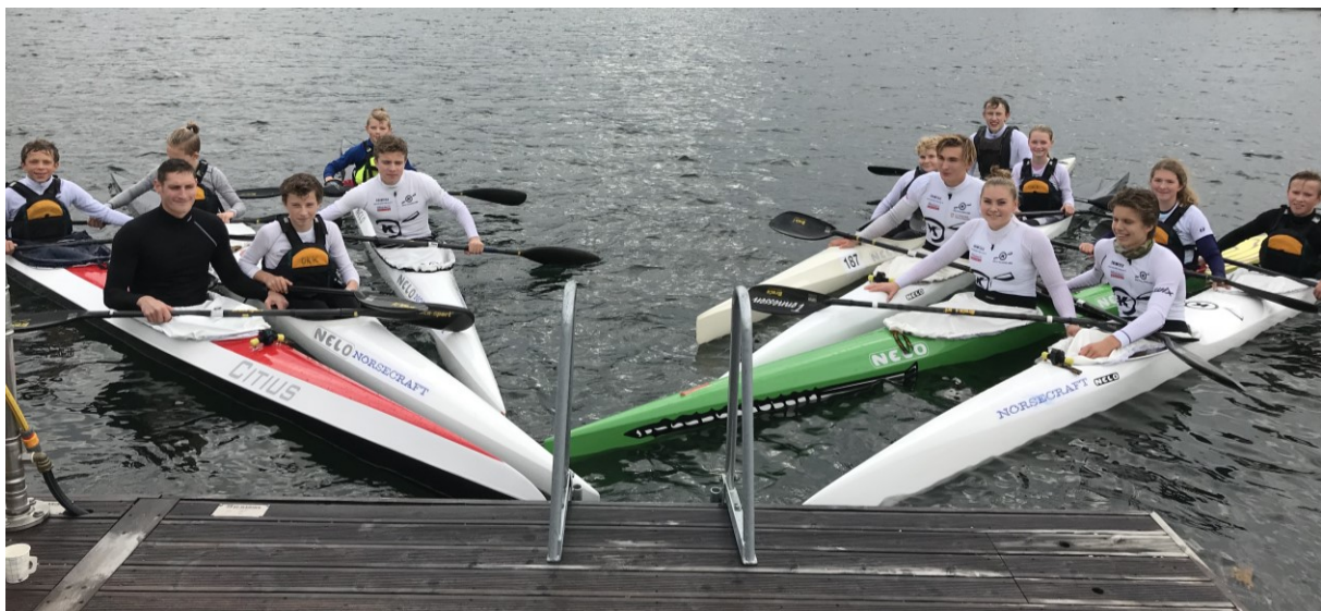
Det er viktig å ha nok lagbåter