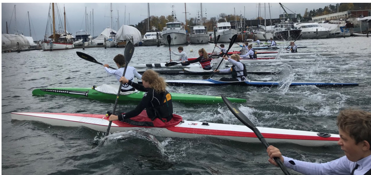
Starten går ved OKK-brygga!