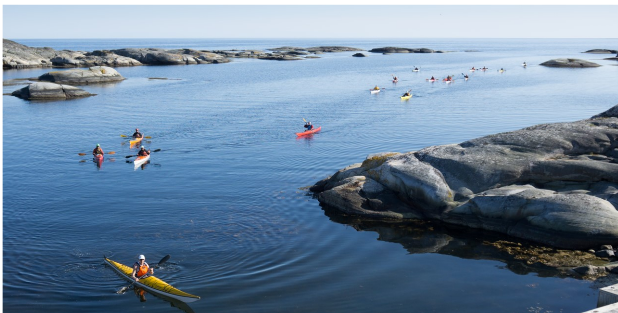
Portør - Havpadlegruppa på tur

Onsdags- og torsdagsturer er kjerneaktiviteten i havpadlegruppens virksomhet, som gjennomføres ukentlig fra slutten av april til og med oktober, kun avbrutt av ferieperioden i juli. I tillegg har vi gjennomført en rekke turer og padletreff med god oppslutning, blant annet vårsamling på Hvasser, aktivitetsledersamling, fyrstur for aktivitetsledere, flere lavterskelturer i Oslofjorden, sommertur til Smøla og avslutningstur til Heestrand.