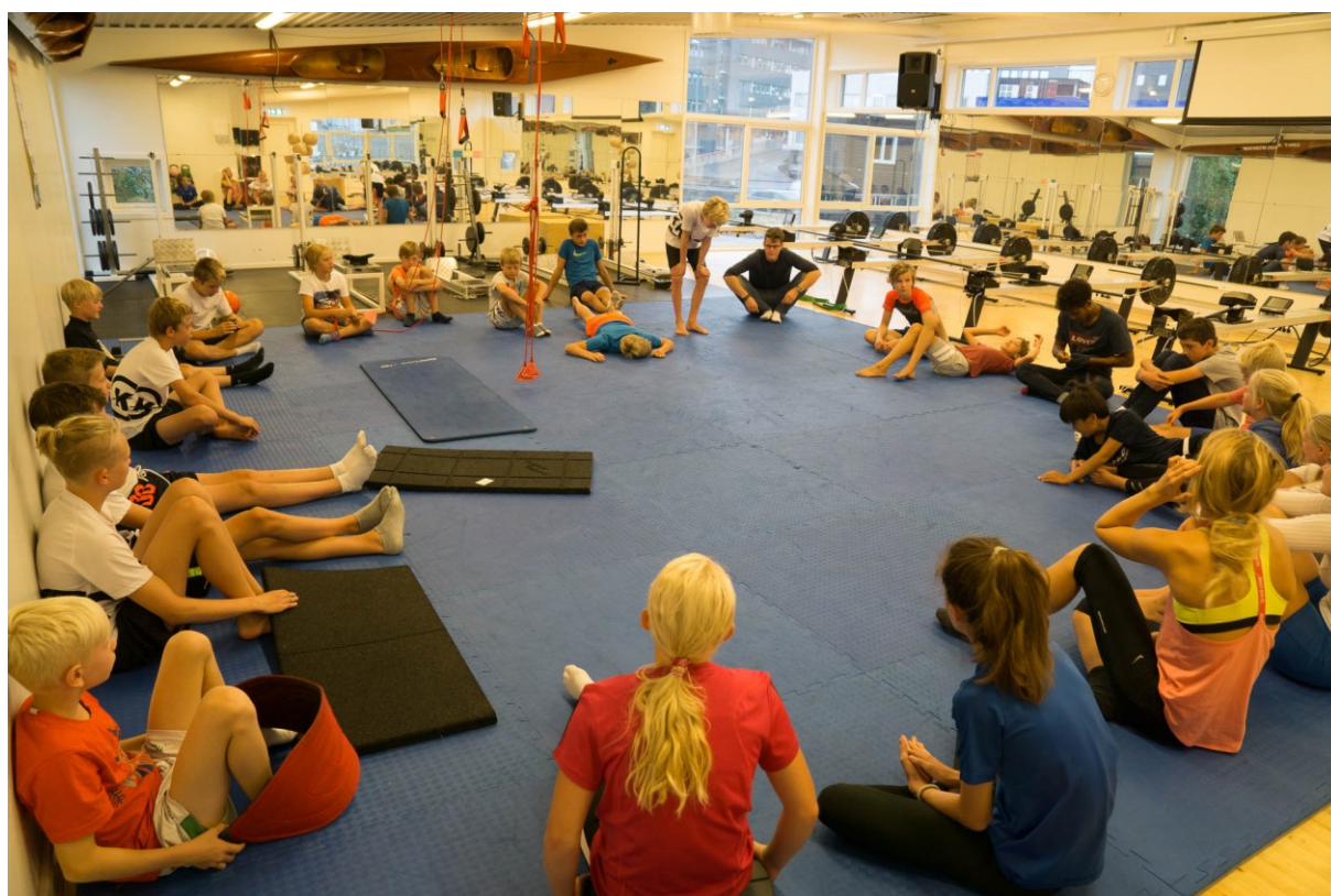
Fra OKKs sommerleir