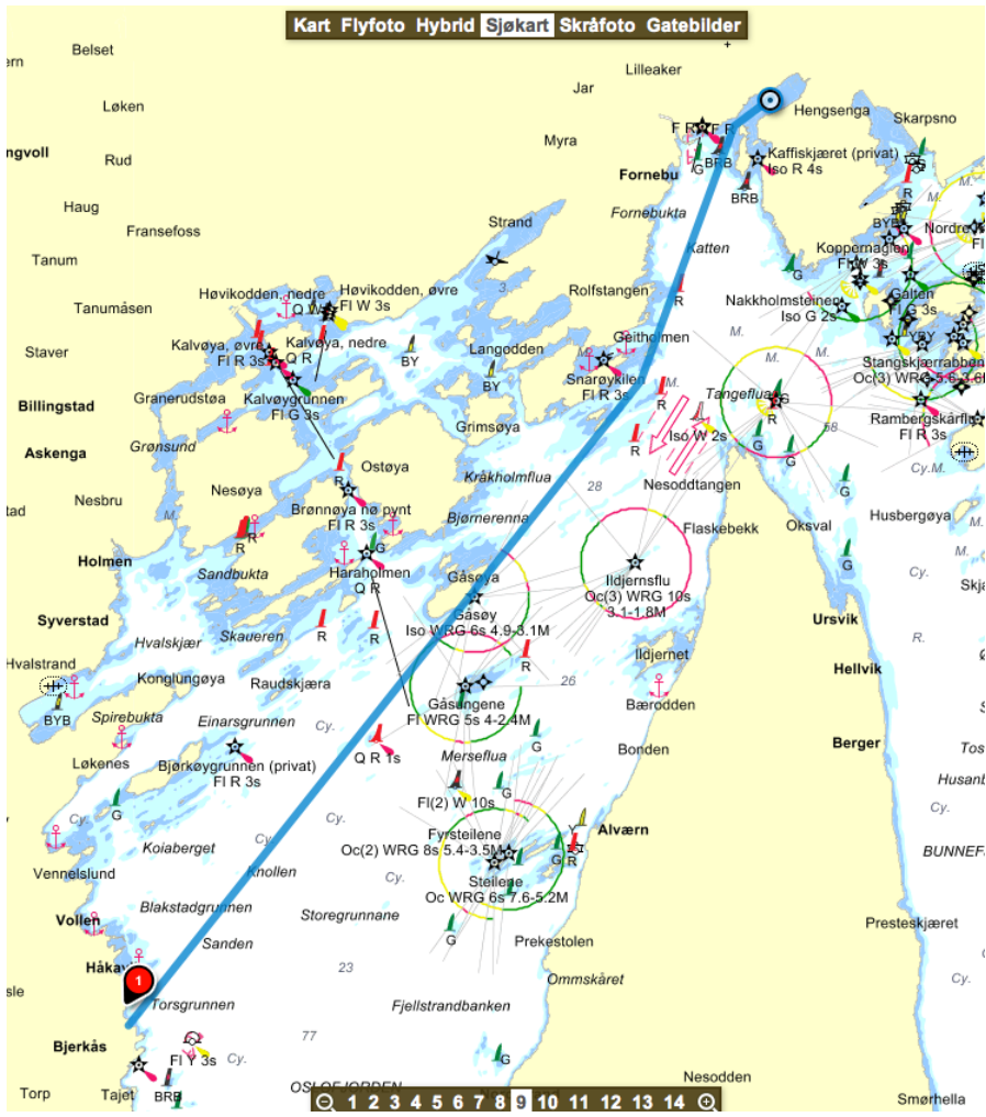
Hele Ruten (ca 17km)